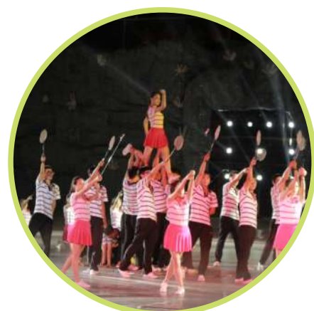
选派员工参加开幕式节目表演