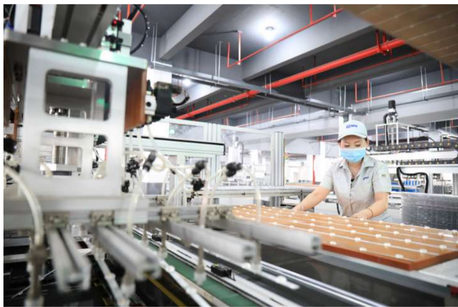
5月18日，公司园七路新厂区，横店室内照明事业部平面灯具车间一名员工正在紧张工作。该车间刚从老厂区搬迁至这里，现已恢复生产。